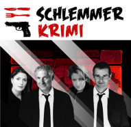
Mord am Frauentorgraben

Tatort Schlossbauernhof – der Klassiker! Schlemmerkrimi in der Scheune mit „Die Urvögel“ 3-Gang-Menü mit Theater € 65,00 p.P.